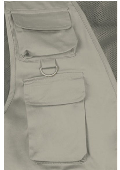
Dettaglio tasche e anello sul petto superiore destro