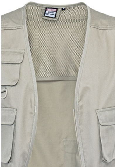
Dettaglio griglia interna sul retro, zona superiore