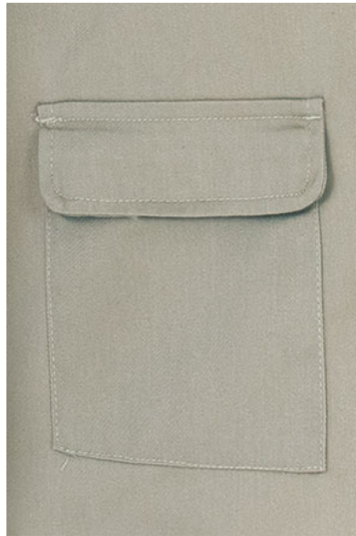
Dettaglio tasca posteriore inferiore con coperchio