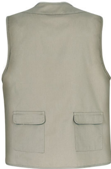
Vista posteriore del capo